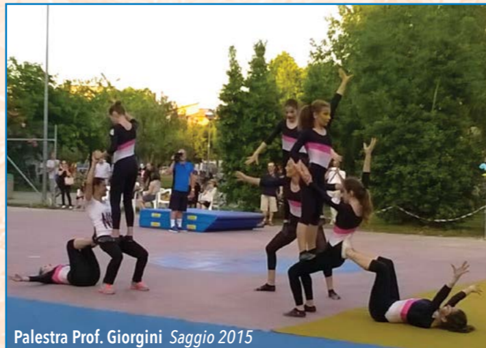
Palestra Prof. Giorgini Saggio 2015