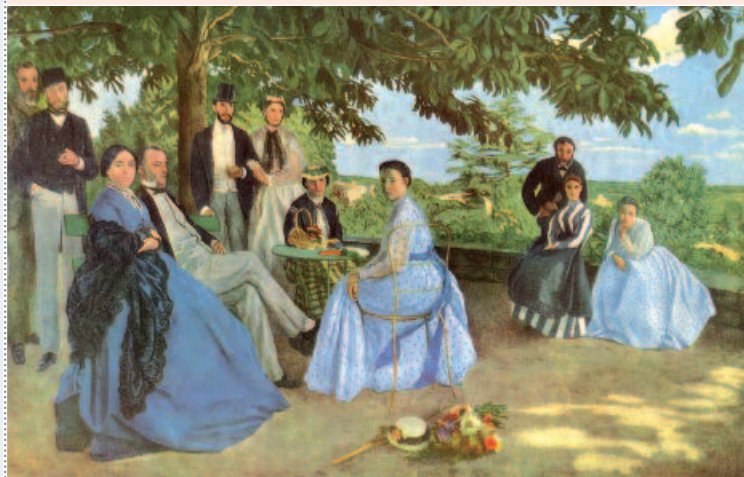
“La riunione di famiglia”, quadro del francese Jean-Frédéric Bazille (1867), che fra i suoi motivi di interesse ha anche la dettagliata visuale di un certo abbigliamento maschile e femminile ottocentesco